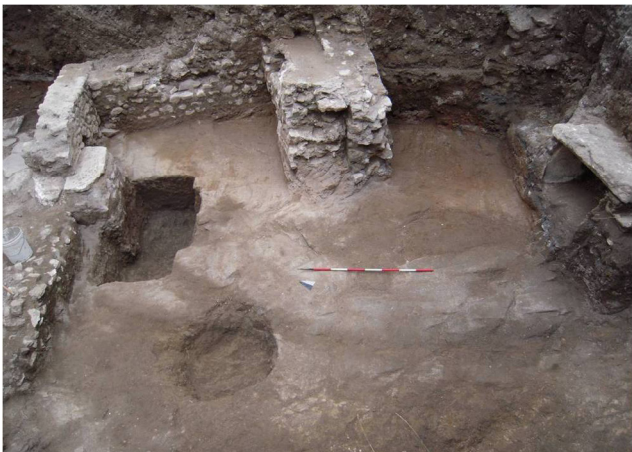
Fig. 3. Resti di strutture antiche, pesantemente intercettate dall'edificio distrutto nella II guerra mondiale, che insistevano su un lembo di necropoli protostorica.

La fossa rettangolare invece, di m 2 x 0,90/1,00 e profonda circa cm 70-75 14 , ancora conteneva la deposizione di un inumato di sesso femminile, anche se i resti ossei risultavano in parte schiacciati e in parte deteriorati dal terreno tufaceo; benché priva di copertura, la sepoltura non è stata intercettata dalle pur