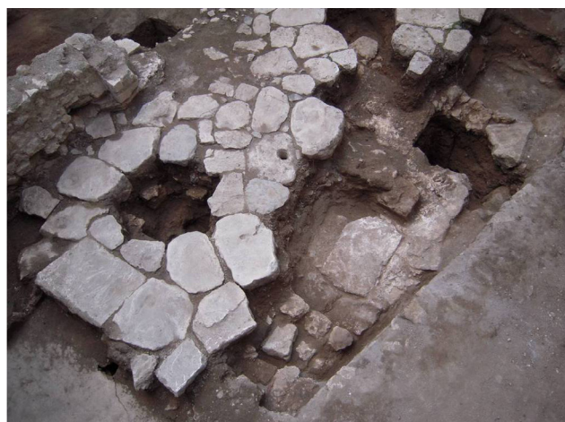
Fig. 2. Area occupata dal basolato e sistemazione a lastre di testina di travertino rinvenuta al di sotto del piano stradale antico.