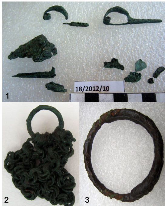
Fig. 6. Corredo di ornamenti personali in bronzo e ferro della sepoltura femminile: fibule in bronzo con arco a sanguisuga piena e a navicella (1), anello in bronzo con catenelle appese (2); armilla in ferro a capi sovrapposti con filo bronzeo attorcigliato (3).

corpo tendente a piriforme o, se si vuole, concavo-convesso, attestate in fasi coeve o anche più antiche a Tivoli stessa 21 , a poca distanza da Tivoli – ad es. a Pian Quintino 22 – o ad Anagni 23 , che testimoniano la molteplicità di articolazioni tipologiche in questo segmento produttivo e in questa regione, con diffusione significativa e assonanze a volte singolari nella vicina Fossakultur campana 24 . Questa eredità formale dell'impasto orientalizzante, affiancata e arricchita dalle esperienze maturate negli ultimi decenni del VII sec. a.C. nell'ambito dei buccheri 25 , sembra del resto essere accolta in tipi affini – ma con modifiche nell'andamento di anse, corpo e collo – a loro volta attestati tra valle del Sangro, valle del Volturno, di-