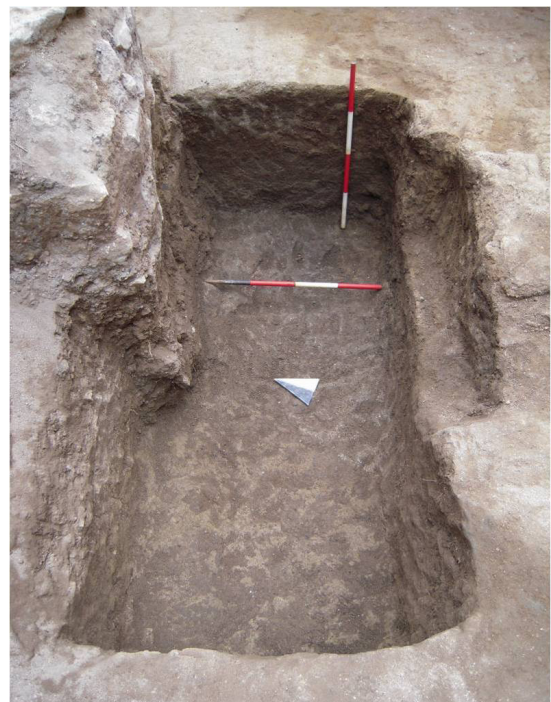
Fig. 4. Tomba a fossa di inumato scavata nel banco di tufo.

La fossa presentava un avvallamento, in corrispondenza della deposizione della defunta, che risultava orientata in direzione est-ovest, come nella mag-