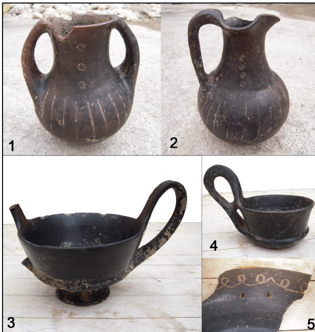
Fig. 5. Corredo vascolare della sepoltura femminile: anforetta (1) e oinochoe (2) di impasto bruno; kantharos di bucchero (3); kyathos di impasto (4); piatto carenato di impasto con decorazione a festoni (5).

Per quanto attiene al corredo vascolare, c'è da sottolineare la dislocazione di anforetta (fig. 5.1), oinochoe d'impasto (fig. 5.2) e kantharos di bucchero (fig. 5.3) presso il capo della defunta su uno dei lati brevi, in un unico gruppo, quasi a condensare qui il servizio "completo" destinato al consumo dei liquidi a tavola. Al contrario, il "piatto" carenato d'impasto (fig. 5.5), di diversa funzionalità, è stato rinvenuto, isolato, all'estremità opposta della fossa, mentre due tazzine con alta ansa bifora (fig. 5.4) – forma assai diffusa e già ben nota da ritrovamenti sporadici a Tivoli, e.g. in Piazza del Governo 17 – erano sul lato destro del cadavere, in posizione prominente, si direbbe non lontano dalle mani, con collegamento diretto, quindi, alla funzionalità dei vasi stessi (per attingere