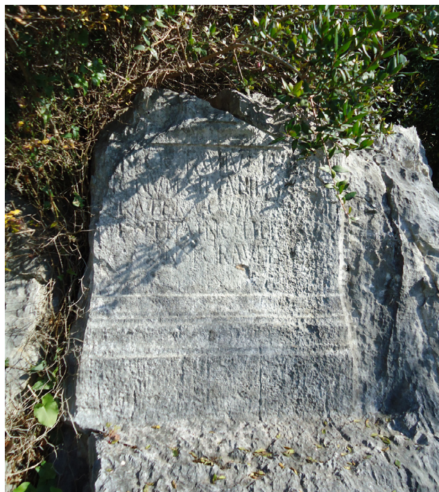
Fig. 6. Iscrizione rupestre posta da Phainus insieme al padre Cn. Octavius Eu[---] .

I tre documenti qui riconsiderati sono da attribuire a una famiglia le cui origini furono certamente libertine e i cui membri vissero a cavallo tra il I e il II sec. d.C. Il cognome Phainus , di origine greca, conta solo una dozzina di attestazioni in tutto l'Impero, di cui la metà a Roma 27 , inquadrabili cronologicamente tra il I e il III sec. d.C. Particolarmente interessante per l'associazione tra il gentilizio Octavius