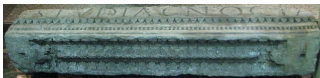
Fig. 3. Particolare del soffitto dell'architrave.

È evidente che l'epistilio doveva comprendere, a sinistra, almeno un altro blocco iniziale e, forse, un altro alla fine, se il verbo fecit era scritto per esteso e non abbreviato. Dal punto di vista costruttivo, questo elemento era dotato di un incasso ad angolo per l'alloggio del risvolto laterale, come si rileva in altri esemplari simili. Come minimo doveva trattar-