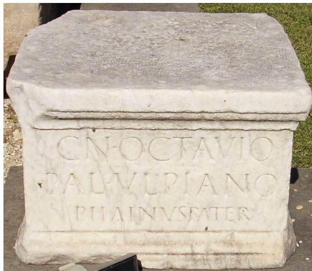
Fig. 4. La base di statua con la dedica posta da Phainus al figlio.

L'architrave di cui si è finora parlato va a sua volta messo in relazione con una base di statua iscritta, attualmente conservata presso il Museo Nazionale Romano alle Terme di Diocleziano (fig. 4) 16 . Il pezzo, la cui scoperta è successiva alla pubblicazione del X volume del CIL , non figura nelle principali sillogi e raccolte epigrafiche. L'unico riferimento si riscontra in un resoconto di L. Borsari del 1891 17 , relativo ai ritrovamenti avvenuti nella Valle durante la costruzione della Stazione Viaggiatori ubicata alle porte del centro urbano, in adiacenza alla via Appia. Alla scoperta di un piccolo edificio, dotato di nicchie alle