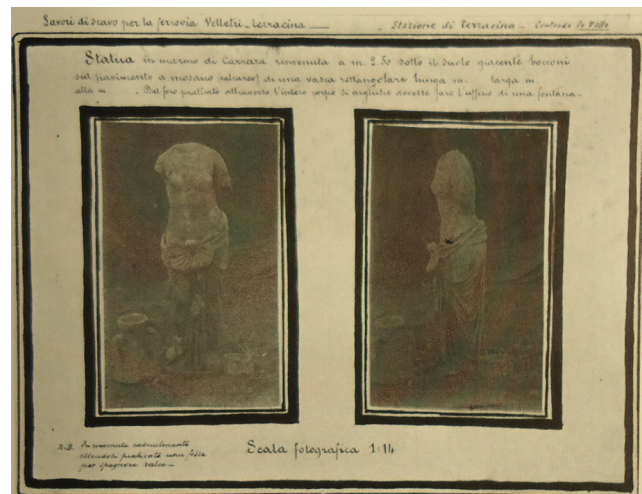
Fig. 5. Statua marmorea di Ninfa, ritrovata nel corso dei lavori di scavo per la costruzione della nuova stazione ferroviaria.

Lo sgombero della parte interna della struttura consentì di individuare due fasi strutturalmente e cronologicamente differenti: la parte più antica era costituita da un vano a pianta circolare (diametro m 2,60) le cui pareti interne erano animate da nicchie alternativamente a sezione rettangolare (4) e semicircolare (3). Lungo il perimetro esterno di forma ottagonale si aprivano, invece, quattro nicchie a sezione triangolare con fori contenenti fistulae : l'accesso all'edificio era garantito da un corridoio, coperto a volta, con le pareti in laterizio. In un secondo tempo