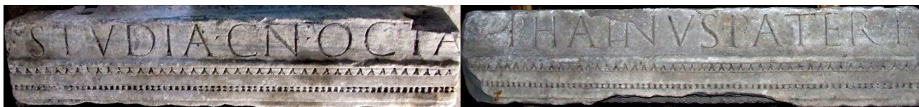
Fig. 2. I due frammenti di architrave con il nome di Phainus.

L'architrave, in marmo bianco, è a fasce e ha il coronamento formato da listello e gola rovescia con un kyma di foglie lisce incise verticalmente alternate a fogliette lanceolate, di cui si vede solo la punta, invece del più consueto kyma lesbio. La modanatura di separazione tra la prima e la seconda fascia è decorata con una fila di perline mal conservate. Il soffitto presenta un lacunare con motivo centrale a doppia treccia delimitato da una modanatura con kyma a foglie d'acanto (fig. 3). Lo stato di conservazione piuttosto scadente della faccia inferiore, ancora con incrostazioni diffuse, non permette d'individuare ulteriori dettagli nella decorazione vegetale. Qui i lati minori sono incurvati per lasciare posto ai fiori d'abaco dei sottostanti capitelli, che sormontavano elementi architettonici verticali, forse colonnine. Si notano, a questo proposito, i fori quadrangolari per l'imperniatura dei capitelli, così come è visibile, sulla faccia superiore dell'architrave, una delle grappe che fissava il fregio alla cornice soprastante. Considerate le proporzioni, si può presumere che l'architrave poggiasse su capitelli di circa un piede di lato e che le colonne, alquanto distanziate, non fossero alte più di 4 piedi (circa m 1,20), evidenziando il carattere ornamentale piuttosto che funzionale della struttura.