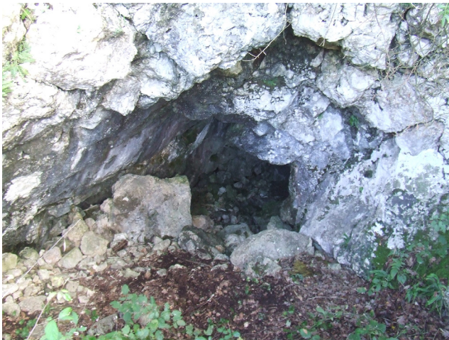
Fig. 6. Monte Saracinisco. Grotta sul versante nord.

immediatamente a ridosso del Garigliano, ed è raggiungibile attraverso una viabilità antica già attestata nelle carte borboniche, che ricalca con ogni probabilità una viabilità precedente.