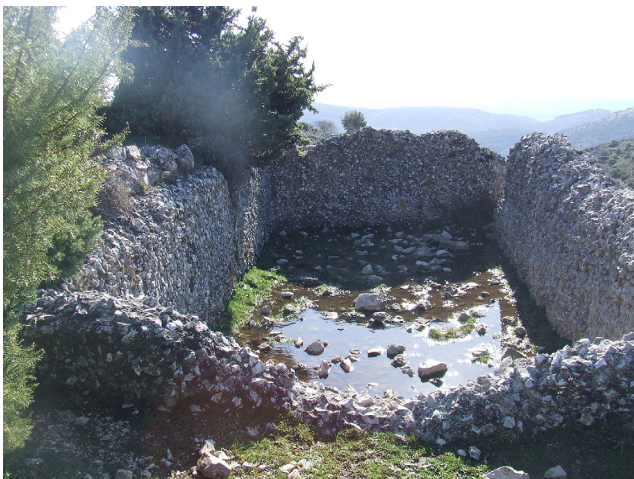
Fig. 4. Monte Fuga. Cisterna.

nianze importanti costituite da una struttura in pietre e malta cementizia, corredata da uno spazio aperto in cocciopesto, e una cisterna sul versante nord del Monte Fuga. Quest'ultima, orientata nord-ovest/sud-est, delle dimensioni di m 7,30 x 3,50, è realizzata in scaglie e pietre di calcare allettate all'interno di una malta cementizia molto tenace (fig. 4).