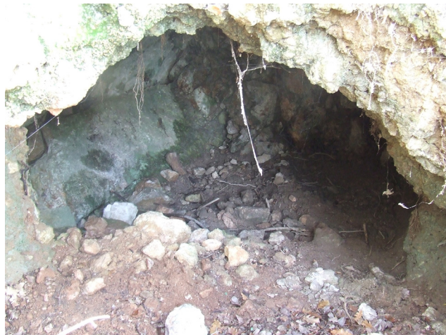
Fig. 10. Monte Castelluccio. Struttura muraria con aperture.

Castelluccio è stata inoltre individuata una struttura all'interno della quale è presente una volta a crociera di "tipo romano", probabilmente ascrivibile a una fase alto-medioevale (fig. 9). Nell'area pianeggiante, tra tali strutture e Monte Castelluccio, sono presenti