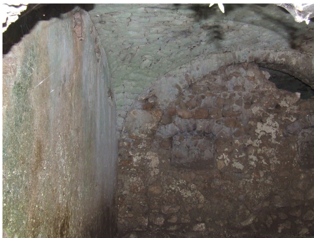
Fig. 9. Monte Castelluccio. Volta a crociera.

Proprio nei pressi di tale percorso sono stati raccolti in superficie frammenti di ceramica a impasto e tornita e tegole ad alette, ad alto indice di frammentazione, che testimoniano una significativa frequentazione antica, compresa tra l'età del Ferro e un orizzonte medioevale (XI secolo). Sul versante meridionale di un colle posizionato a ridosso del Monte