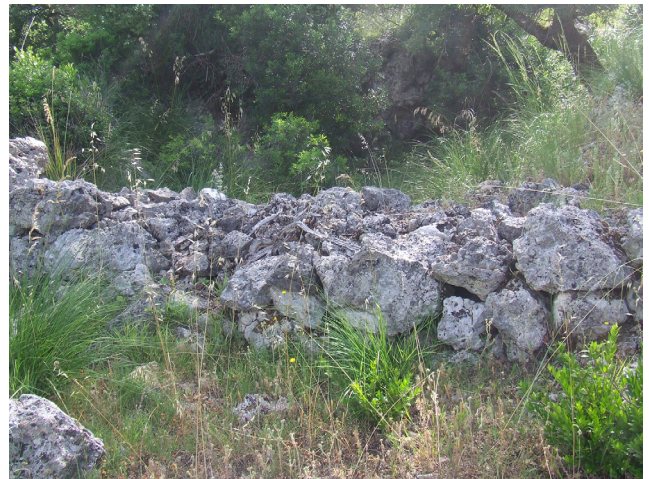
Fig. 7. Monte Saracinisco. Muro di delimitazione della grotta sul versante nord.