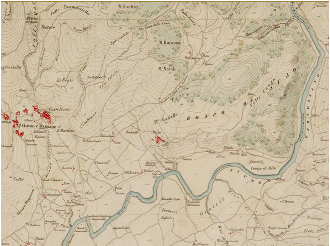
Fig. 5. Stralcio da Tavolette al 20000 per la Carta del Regno di Napoli, anni 1834-1840 (Istituto Geografico Militare, URL http://www.igmi.org/ancient/cerca.php?mode=reg&cod=7 ).

ovoide modellato attorno a due calculi , la cui datazione e funzione sono incerte (fig. 8).