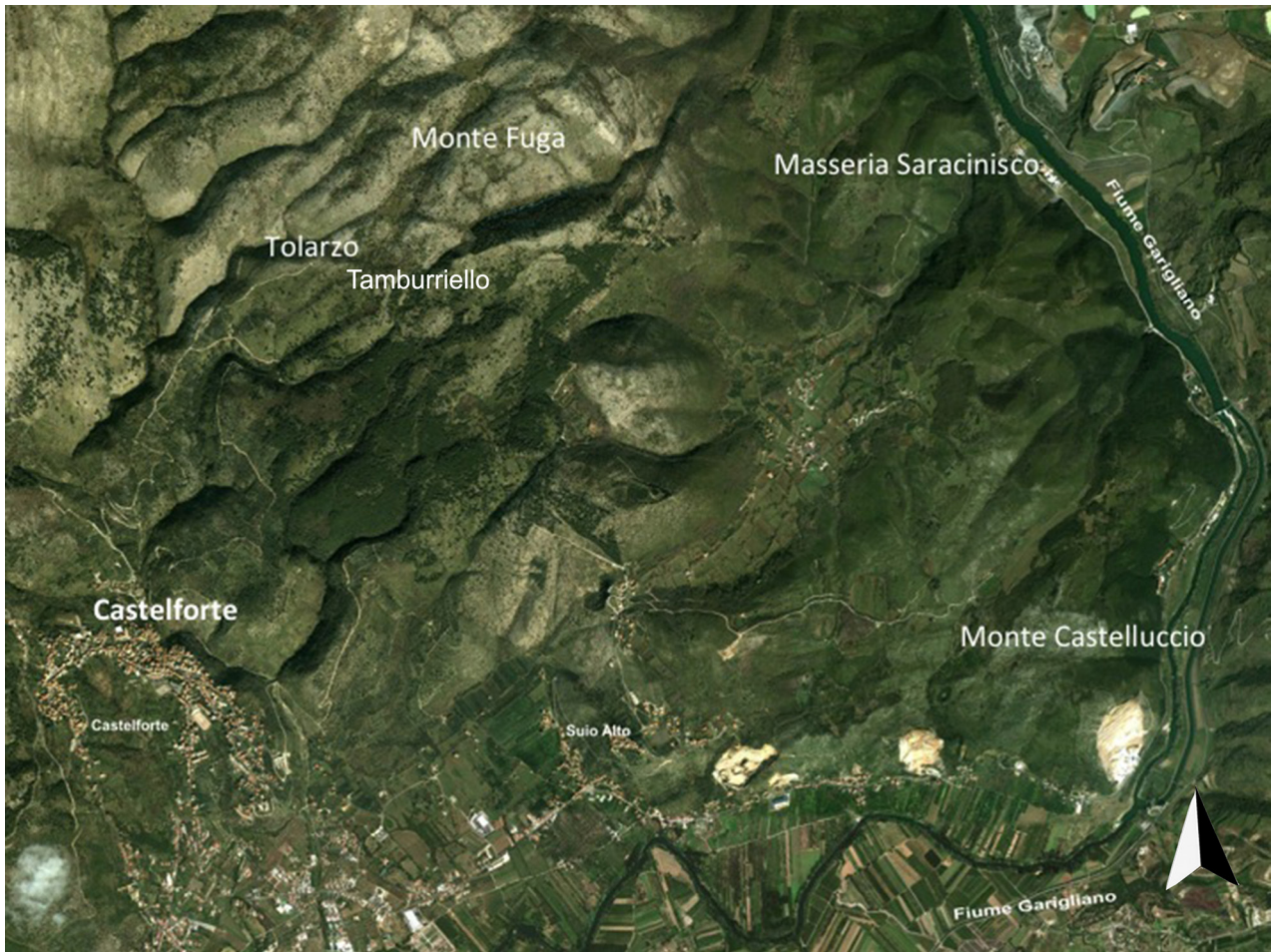
Fig. 3. Areale interessato dalle indagini con l'indicazione dei principali siti, su base satellitare.

nianze importanti costituite da una struttura in pietre e malta cementizia, corredata da uno spazio aperto in cocciopesto, e una cisterna sul versante nord del Monte Fuga. Quest'ultima, orientata nord-ovest/sud-est, delle dimensioni di m 7,30 x 3,50, è realizzata in scaglie e pietre di calcare allettate all'interno di una malta cementizia molto tenace (fig. 4).