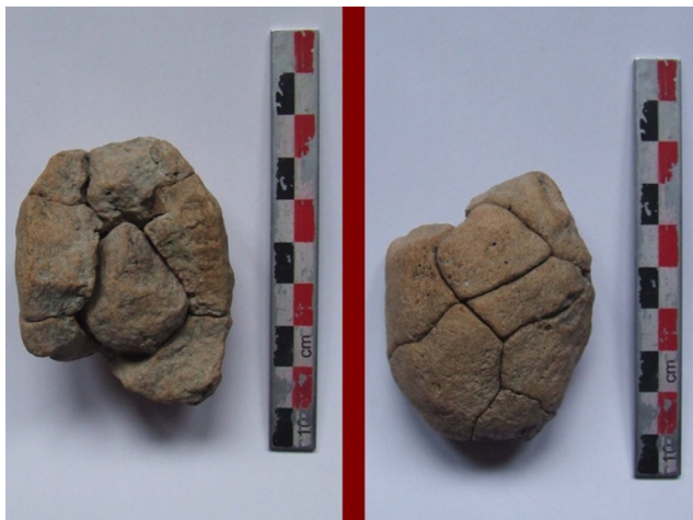
Fig. 8. Monte Saracinisco. Oggetto ovoide di terracotta contenente calcoli.

Proprio nei pressi di tale percorso sono stati raccolti in superficie frammenti di ceramica a impasto e tornita e tegole ad alette, ad alto indice di frammentazione, che testimoniano una significativa frequentazione antica, compresa tra l'età del Ferro e un orizzonte medioevale (XI secolo). Sul versante meridionale di un colle posizionato a ridosso del Monte