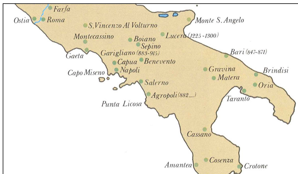
Fig. 1. Presenza musulmana sulla terraferma italiana (dettaglio da: Gabrieli – Scerrato 1979, Tavola IV, p. 107).

Rileggendo le fonti latine, ma anche quelle bizantine e arabe, e con uno sguardo volto oltre i confini regionali, abbiamo potuto rilevare un'immagine ben diversa da quella finora nota.