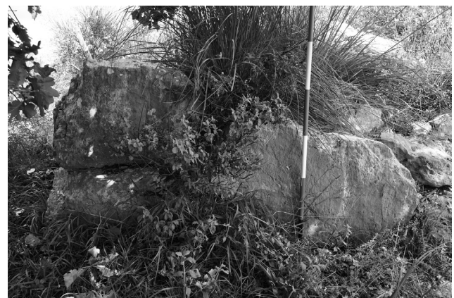
Fig. 3. Arce, "monopirgo" di Monte Piccolo, estremità nord della parete ovest.

Il territorio di pianura è stato oggetto di alcune ricognizioni riguardanti, in particolare, quello che sembra essere un grande insediamento rustico all'estremità meridionale del comune di Colfelice in località Camponi, lungo la via Ortella, tra il Rio Proibito