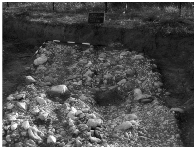
Fig. 8. Ceprano, via glareata, tratto nord-est, limite nord-est (visto da sud-ovest).

In alcuni settori dello scavo si rileva la presenza di concentrazioni di elementi lapidei di dimensioni maggiori, che poggiano al di sopra dello strato di ciottoli fluviali più piccoli e che sono sporadicamente frammenti a frammenti laterizi. È verosimile che i margini della strada non si siano conservati e che fossero in origine costituiti da massi più grandi, che ne formavano cordoli di contenimento leggermente sporgenti rispetto al piano stradale. Inoltre, è stata rilevata una maggiore quantità di frammenti fittili nel tratto viario nord-est (tegole, mattoni, ceramica comune e a pareti sottili).