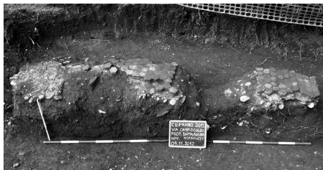
Fig. 5. Ceprano, via Campidoglio, pavimento visto da est.

Tale fascia, che verosimilmente delimitava l'intero pavimento, risulta peraltro parallela alla vicinissima via Campidoglio, che qui ricalca la via Latina . Le piastrelle, alte cm 4, erano alloggiare su uno strato di preparazione di calce spesso circa cm 5, sovrapposto a un livello di ciottoli fluviali a loro volta poggianti (probabilmente con una funzione di vespaio di drenaggio) su uno strato di terreno compatto di colore verdastro. Più in basso c'era un altro strato di natura antropica (terra frammista a frammenti di laterizi)