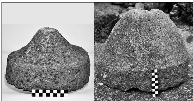
Fig. 4. Colfelice, Camponi, metae di macine romane.

L'identificazione di Ceprano col Fregellanum noto dall' Itinerarium Antonini 16 , ormai unanimemente condivisa, trova peraltro conferma in alcune fonti di origine medioevale di recentissima edizione, che fanno riferimento alla " Campanie villa olim Fregellanus dicta et modo vocatus Ceperanus " 17 . Presso Fregellanum , verosimilmente nella zona di S. Antonio, confluiva forse nella via Latina anche l'antica strada