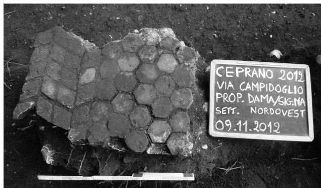
Fig. 6. Ceprano, via Campidoglio, particolare del pavimento visto da ovest.

che copriva due livelli naturali, rispettivamente a matrice limoghiaiosa e argillosa.