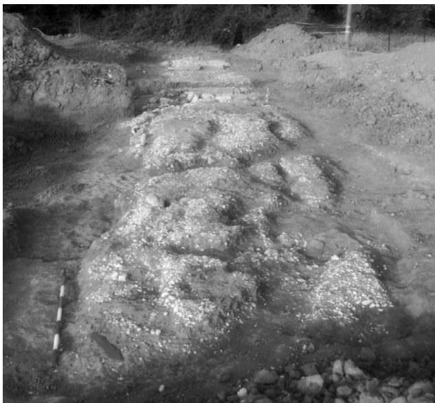
Fig. 7. Ceprano, via glareata, tratto sud-ovest (visto da nord-est).

La via, ubicata in prossimità di altre aree d'interesse archeologico 31 , è stata intercettata circa m 270 a est della confluenza di via Campo Le Monache nella via Pennea (C.T. Fg. 29, part. 742), in un terreno in leggera pendenza formatosi su strati alluvionali recenti del fiume Sacco, pertinenti a fasi oloceniche. Durante lo scavo, nell'estremità meridionale della