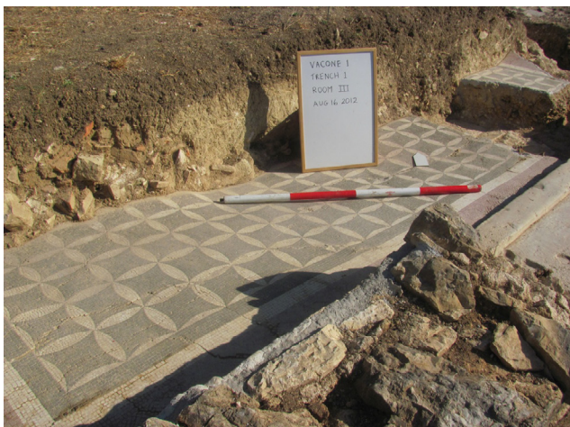
Fig. 8. Stanza III, mosaico bianco e nero con bordo in pietra di Cottanello.

le nell'angolo sud-orientale della stanza (fig. 9) 21 . Il fatto che le pietre impiegate per costruire le pareti della tomba tagliassero il pavimento dimostra che la sepoltura fu realizzata quando ormai la villa versava in stato di abbandono 22 . Non è stato rinvenuto alcun corredo insieme al corpo, ma lo scheletro si presentava in buono stato di conservazione, a eccezione del cranio, fratturato in diverse parti e disperso dalla crescita della radice di un albero.