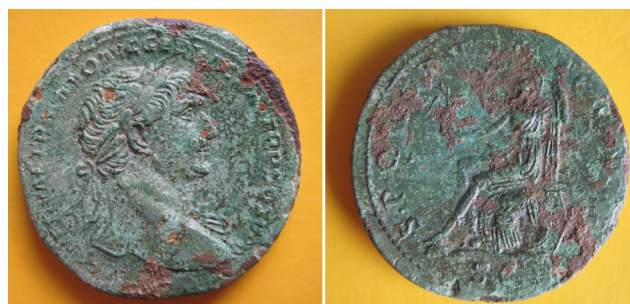
Fig. 7. Sesterzio in lega bronzea di Traiano (RIC II 489).

Il sesterzio è stato rinvenuto nella Stanza III, un ambiente con pavimento a mosaico bianco e nero recante una teoria di losanghe a lati concavi in tessere nere, inscritte entro circonferenze in tessere bianche con bordo rosso lungo il perimetro della stanza (fig. 8). Lo stesso ambiente ha restituito un altro significativo ritrovamento: è stata qui trovata la sepoltura di un bambino di età compresa probabilmente tra i tre e i cinque anni, in una tomba, con pareti ricoperte da pietre, che tagliava il mosaico pavimenta-