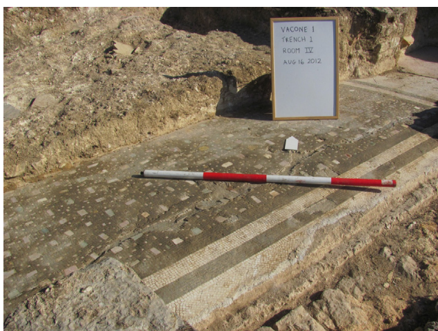
Fig. 5. Decorazione musiva della Stanza IV.

I principali rinvenimenti databili sono frammenti di terra sigillata italica, trovati sia al di sopra dei