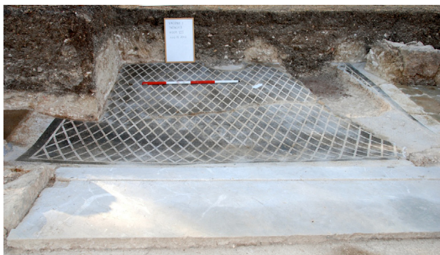
Fig. 4. Pavimento musivo della Stanza VII danneggiato dai lavori agricoli.

Gli scavi hanno inoltre restituito due mosaici in opus scutulatum (fig. 5), tecnica presente in due esempi databili a età tardo-repubblicana o alto-imperiale rinvenuti nell'area della basilica di Forum Novum 19 .