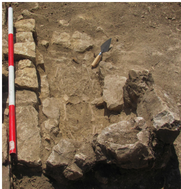
Fig. 9. Sepoltura d'infante nella Stanza III.

L'angolo sud-orientale della Stanza III ha anche fornito la miglior prova dell'esistenza di una fase precedente della villa sotto i pavimenti a mosaico. Questa consiste in un muro in pietra, rinvenuto al di sotto della sepoltura del bambino, che forma la divisione tra la Stanza III e la Stanza IV. Il muro presentava intonaco non dipinto su entrambe le facciate al di sotto del livello del mosaico pavimentale di queste due stanze, suggerendone una costruzione precedente alla realizzazione dei pavimenti. Lo scavo dello strato di riempimento al di sotto del taglio della tomba ha portato alla luce frammenti d'intonaco dipinto di uno stile marcatamente differente rispetto a quello rinvenuto sui muri e negli strati di caduta sui pavimenti a mosaico della fase successiva della villa. Non sono, invece, venuti alla luce in questo strato frammenti di ceramica, ma la scoperta di alcuni lacerti di ceramica a vernice nera in altri punti dello scavo suggerisce l'esistenza di una fase repubblicana della villa, cui potrebbe risalire il muro che scende al di sotto dei mosaici pavimentali, in probabile corrispondenza cronologica con la muratura in opus incertum impiegata nella costruzione della cisterna e del