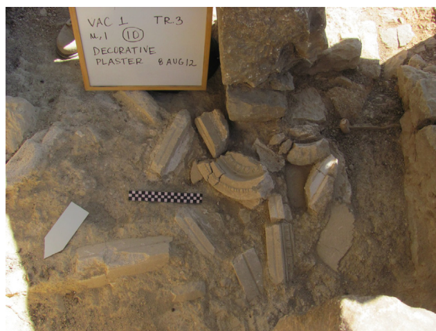
Fig. 6. Stucchi rinvenuti nella Stanza VI.

pavimenti a mosaico sia fuori contesto in strati più superficiali.