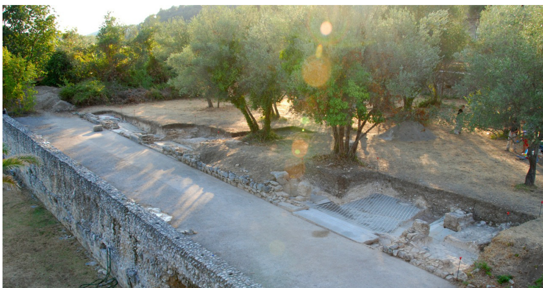
Fig. 3. Criptoportico sopra cui si trovava il mosaico asportato e ambienti rinvenuti durante lo scavo 2012.

Come nella villa di Cottanello, questi colori sono stati impiegati per creare motivi geometrici che trovano abbondanti riscontri nei mosaici bicolori bianchi e neri della prima età imperiale; la disponibilità a livello locale della pietra rossa di Cottanello spiega agevolmente la prevalenza di questo colore in disegni solitamente caratteristici dei mosaici in stile bicromo. Il mosaico a reticolo di losanghe rinvenuto nella Stanza VII trova un confronto diretto con quello della Stanza 10 della villa di Cottanello (fig. 4) 17 , mentre il mosaico del portico asportato dalla Soprintendenza aveva lo stesso schema geometrico rinvenibile nella Stanza 2 a Cottanello 18 .