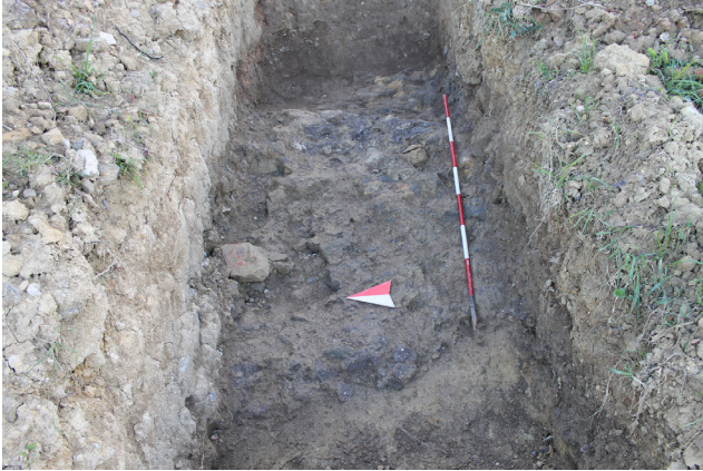
Fig. 4. Fonte Nuova. Particolare del livello di preparazione esposto all'interno della trincea I.