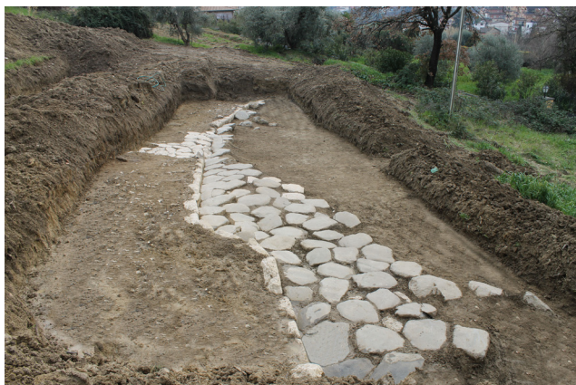
Fig. 2. Fonte Nuova. Veduta generale della via Nomentana.

no. Il tracciato, estremamente rimaneggiato, è conservato integralmente solo lungo il margine orientale, con la crepidine e parte del basolato, mentre quello occidentale è del tutto mancante.