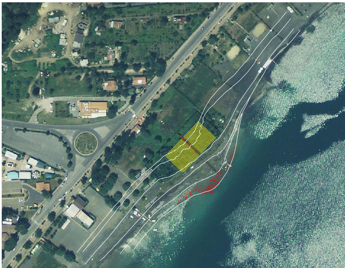
Fig. 1. Localizzazione del sito. Lago Albano, Castel Gandolfo (Roma).

A partire dal 2001 le condizioni climatiche e i prelievi di acque di falda hanno progressivamente ridotto il volume del lago con un arretramento della linea di riva superiore ai m 40. L'insediamento, prima totalmente sommerso, risulta ora pienamente esposto e caratterizzato, in superficie, da un'area con una forte concentrazione di pietre di varie dimensioni, numerose teste di palo e abbondanti frammenti di ceramica e di fauna; la sua estensione ad oggi è sti-