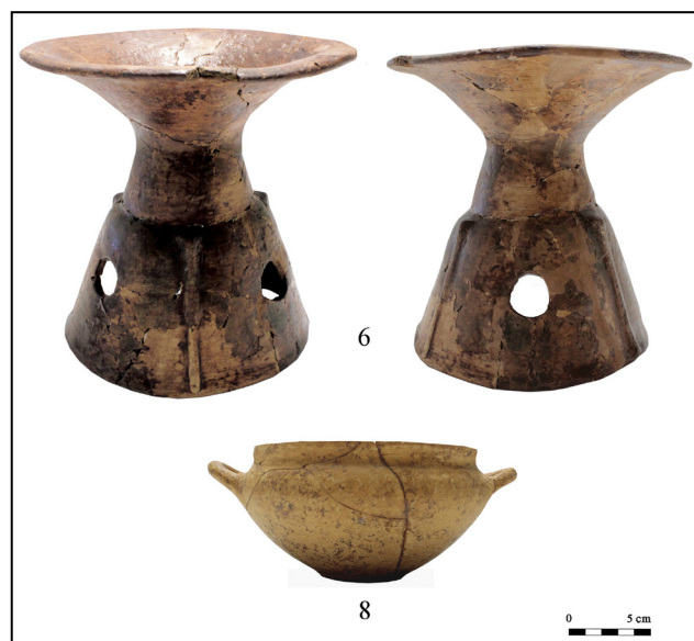
Fig. 3. Calefattoio/sostegno e skyphos dalla tomba 12 di Colonna, loc. Barberi.

ratteristiche formali comuni a fogge laziali e veienti 6 . Inoltre, alcune similitudini con il sostegno monumentale dell'Esquilino, i piattelli su piede decorato e i successivi holmoi 7 aiuterebbero a riconoscerci una produzione "tarda", documentata nell'ultimo quarto dell'VIII sec. a.C. in Etruria meridionale e nel Lazio. La sepoltura s'inserisce dunque nel panorama delle tombe di guerrieri coeve, note in numerosi contesti sia romani sia laziali. Il corredo ceramico, interpretabile come "vasellame da servizio" 8 , sarebbe da mettere in relazione alla pratica cerimoniale del banchetto quale indicatore di status e di ruolo, in un momento prossimo alla formazione delle élites aristocratiche nel Latium vetus 9 .