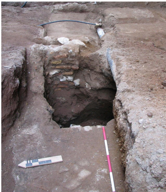
Fig. 2. Veduta dell'imbocco del silos da nord.

Al centro dell'area scavata è un silos con tipico impianto di età tardo-medievale/moderna, realizzato nel banco roccioso, con sezione ovoide della tipologia cosiddetta "a fiasco", bocca stretta, spancio e restringimento verso il fondo. L'imbocco subcircolare (diametro cm 70) con risega per la sistemazione della copertura a tegole, chiusa a sua volta da terra, è fornito di colpetto superiore che ne delimita l'accesso e funge da "imbuto" per riversare i contenuti all'interno del silos. Per le sue caratteristiche, il silos messo in luce, pur non restituendo materiale datante, è confrontabile con le numerose fosse granarie datate all'età tardo-medievale 3 . Sul suo lato nord si è conservato un piano di lavoro costituito da mattoni e bozze di calcare, mentre a sud si è rinvenuta una seconda vasca interpretabile a titolo di mera ipotesi come area dedicata alle operazioni di riempimento e svuotamento del silos, delimitata da un piccolo cor-