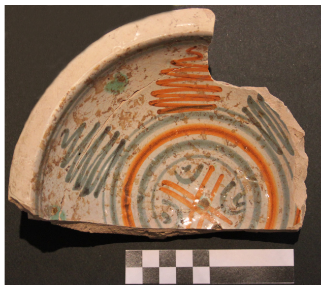
Fig. 3. Frammento di catino con decorazione a monticelli (XVI secolo).

Il rinvenimento di questi reperti conferma il termine di vita delle strutture rinvenute nella piazza al XVII secolo. I frammenti in maiolica, di costo non elevato, sono pertinenti a ciotole, piatti, brocche o boccali, decorati con noti motivi ornamentali, caratterizzati dall'uso di un tipico blu e realizzati su una base bianca di smalto. Sebbene alcuni esemplari siano ricoperti da uno smalto povero, tendente al grigio, i manufatti sono mediamente di discreta qualità e co-