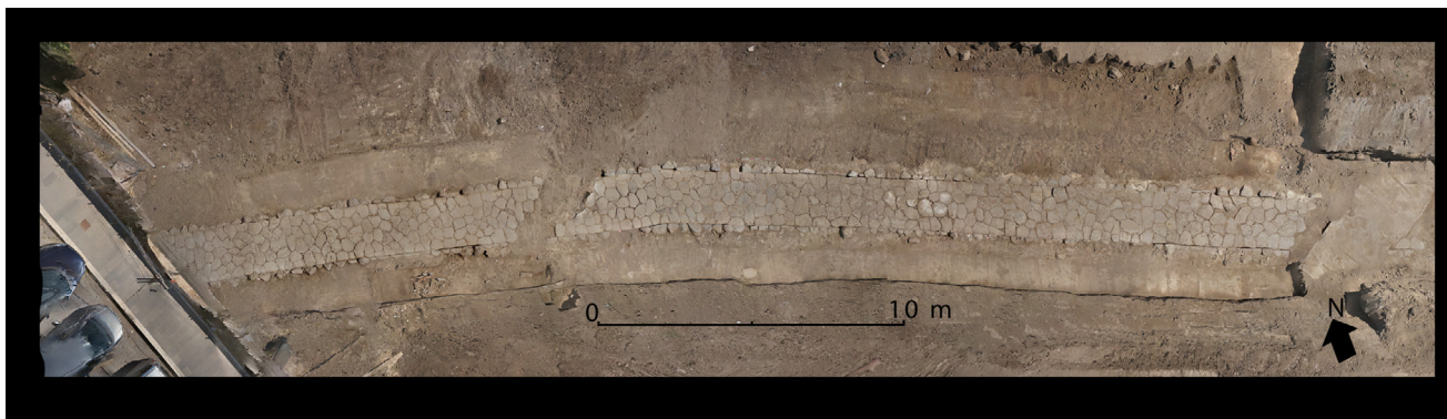
Fig. 3. Ortofoto del tratto basolato a ovest della via Nettunense Nuova.

lineari intatti dello stesso tracciato, che però risulta danneggiato nella restante area da lavorazioni e scavi moderni (fig. 3).