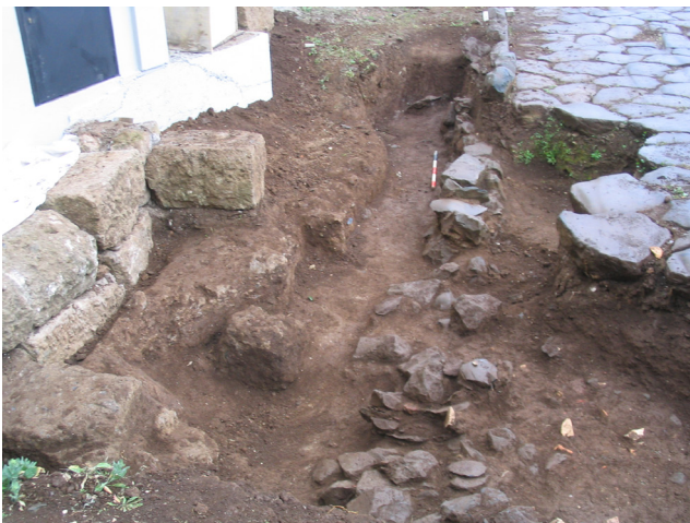
Fig. 2. Panoramica generale dell'area di scavo presso il sito A Soleluna – plesso scolastico.

Questa struttura si trova allineata esattamente in corrispondenza con la soprastante crepidine del tracciato in basoli, ma distante da esso per circa cm 50/60 in profondità; doveva costituire in origine una spalletta di contenimento di un precedente tracciato 3 , il cui fondo era caratterizzato dalla presenza di scaglie di leucite costipate con argilla e frammenti laterizi.