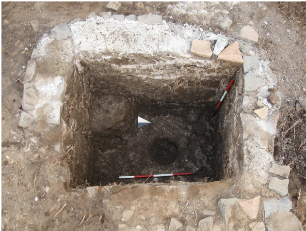
Fig. 3. Struttura a uso produttivo presso il sito di Via Paganico.

solo in queste ultime fasi, mentre risultano del tutto assenti nelle stratigrafie ascrivibili al primo V secolo.