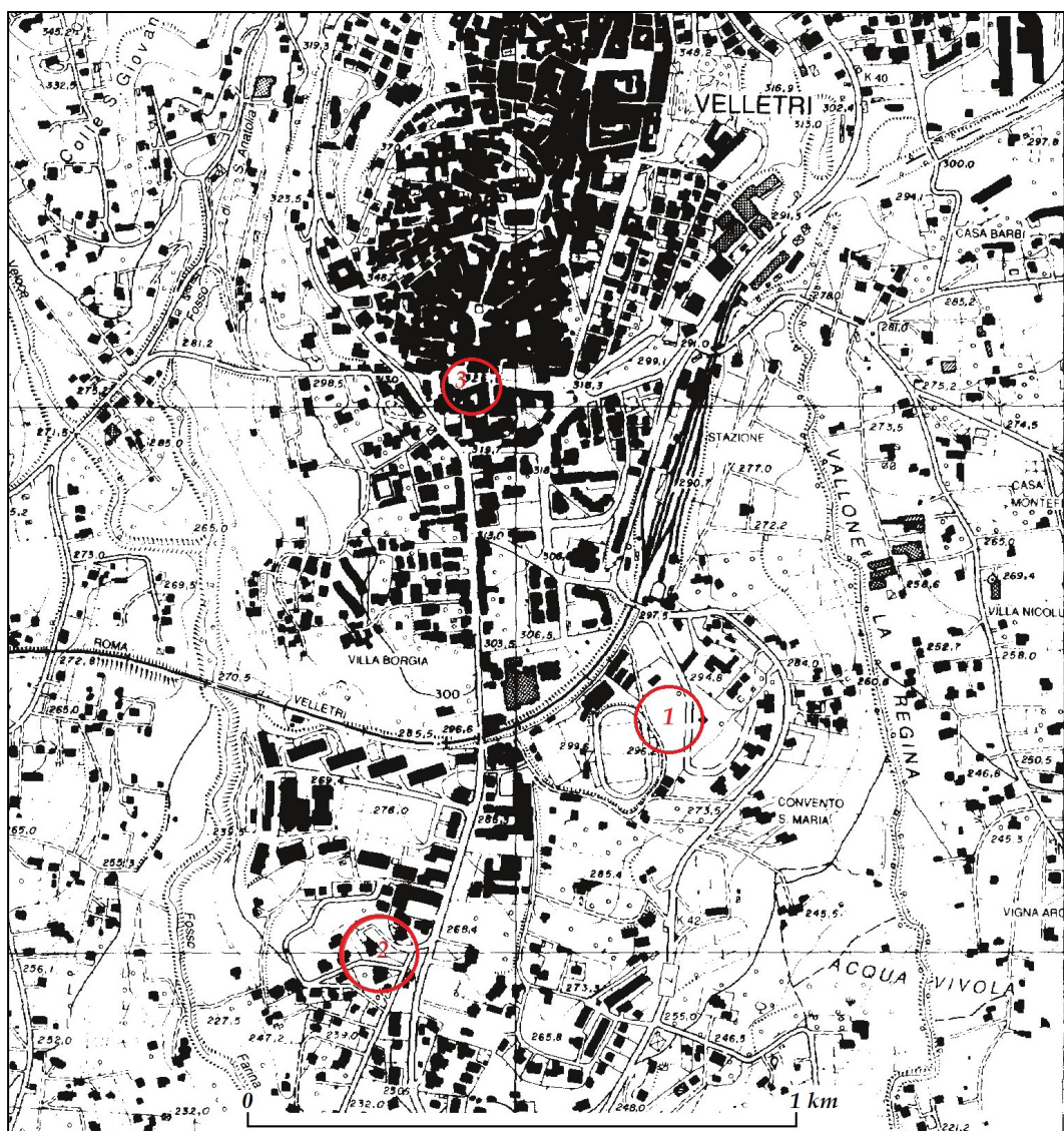
Fig. 1. Stralcio della Carta Tecnica Regionale, con indicazione dei contesti citati nel testo: 1) Colle Palazzo; 2) Paganico; 3) Velletri - Piazza Caduti sul Lavoro.

Nell'immediato suburbio meridionale di Velletri, in località Colle Palazzo (fig. 1, 1), si è individuato un